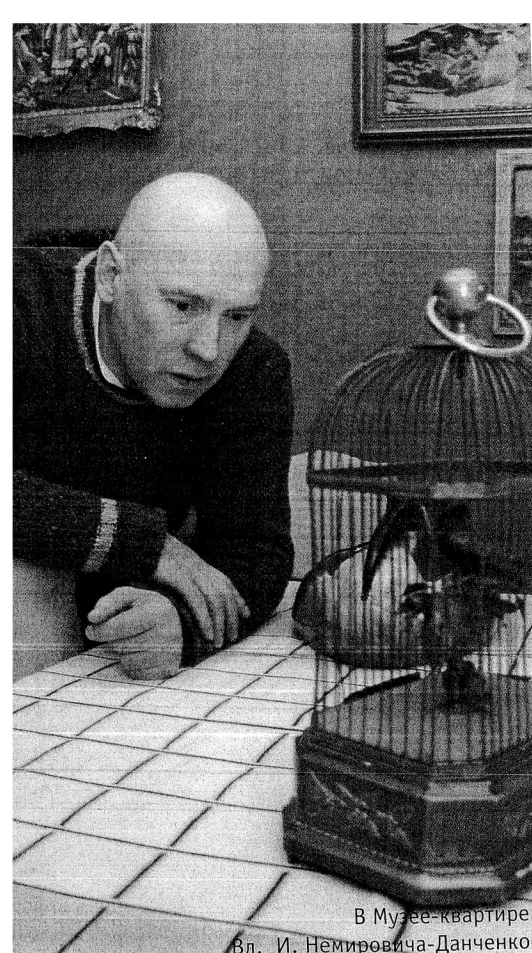
В Музее-квартире Вл. И. Мейровича-Данченко